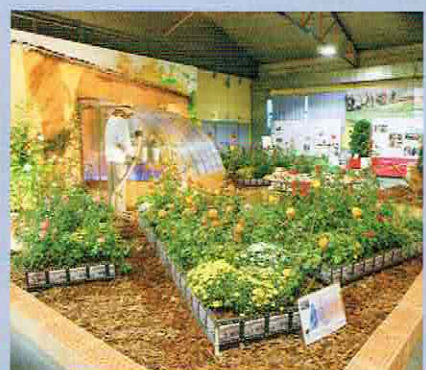
Grand Rendez-Vous 2017