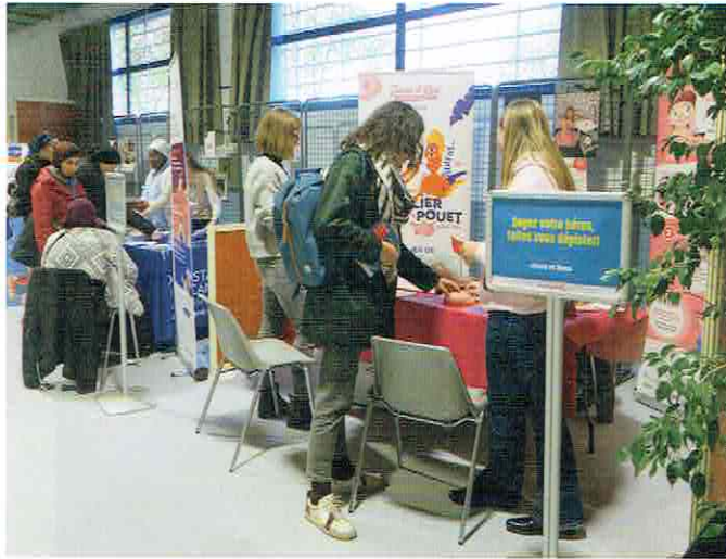
Rendez-vous avec ma santé

Ils innovent, expérimentent, ne se contentent pas de ce qu'ils savent faire, mais explorent des pistes pour resserrer les liens et renforcer la continuité territoriale entre nos quartiers. Je tiens à saluer l'engagement de chacun au plus près des habitants, le travail de tous les acteurs de terrain et de nos partenaires institutionnels. Expérimentation "Territoire zéro non-recours" dans le quartier Moulin-à-Vent, accueil de jour médicalisé à la Résidence Ludovic Bonin, premier forum « Rendez-vous avec ma santé » et premier forum des Associations, Cité de l'emploi, Cité éducative, premières Assises de l'insertion, Vénissieux avance dans toutes ses composantes.