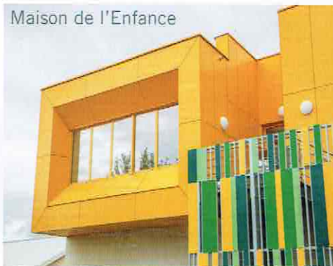
Maison de l'Enfance