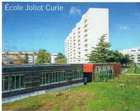
École Joliot Curie