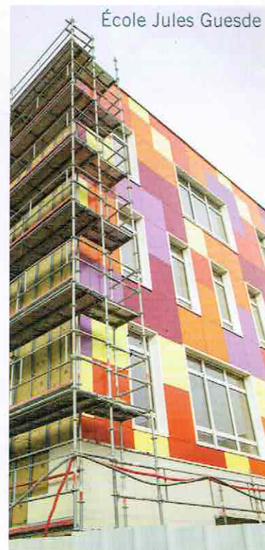
École Jules Guesde